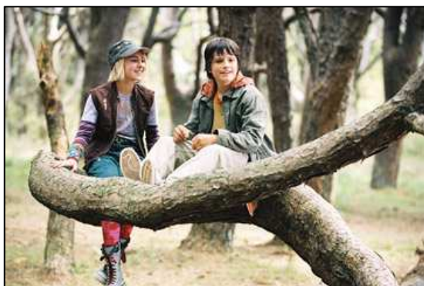
Un ponte per Terabithia

Costi e finanziamenti: il costo del progetto pari a € ---,00 è finanziato dal Piano Diritto allo Studio con delibera n° 20 del 27/11/08.